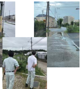
【冠水箇所調査】 関係機関と連携・調整中