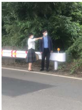
【カーブミラー設置決定】 印西中付近T字路