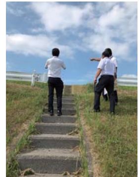
関係各課による土手道の調査