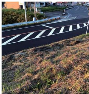
【道路の補修・修繕】 356号 木下東交差点付近