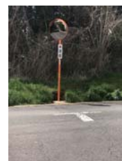
カーブミラー設置 【小林大門下】