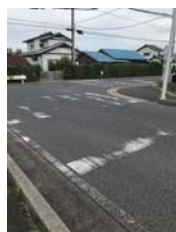
横断歩道白線補修 【草深】