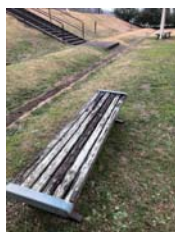
ベンチ改修：6カ所 【本埜公民館裏芝生広場】