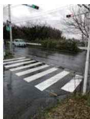
信号機新設 【浦部駐在所前】