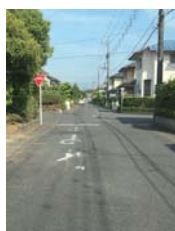
一時停止線補修 【小林北1丁目内】