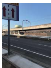
464号線舗装修繕 【東の原】