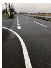
道路線補修 【小林北ボプラ通り】