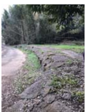
被災道路斜面補修 【鎌刈・和泉・竹袋】