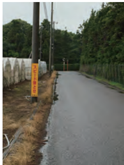
【印旛明誠高校正門前道路（草深）】 「スピード落とせ」の看板設置

この路線（一部）においては現在、道路拡幅・歩道設置工事の実施（来年度）に向け、設計業務を実施しています。