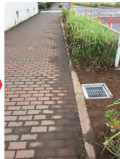
【小林中学校横】 歩道の冠水→排水溝の設置等