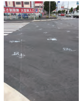
【木下駅南口入口交差点】 冠水→切削オーバーレイ工法により改良工事準備中 (120㎡)